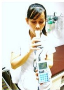
การตรวจสอบรูปภาพปอด